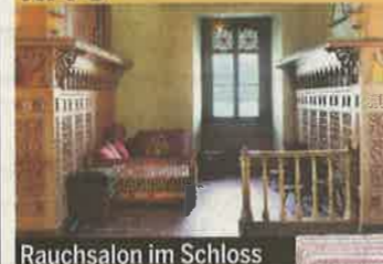
Rauchsalon im Schloss