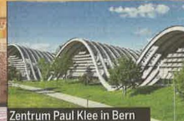
Zentrum Paul Klee in Bern