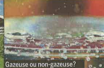
Gazeuse ou non-gazeuse?